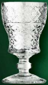
アブサント アンボウズグラス 入数 6