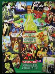
グランドアブサント メタルポスター 入数 1