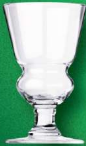
アブサント グラス 入数 6