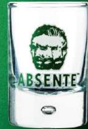
アブサント ルミナス ショット グラス 入数 6