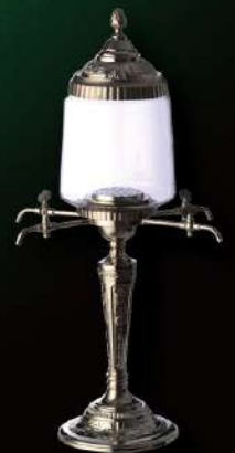
ファウンテン 4 口 入数 1