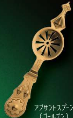
アブサントスプーン (ゴールデン) 入数 10