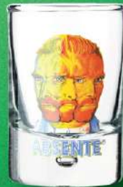
ゴッホ ショット グラス 入数 6