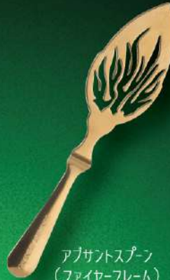
アブサントスプーン (ファイヤー-フレイム) 入数 10