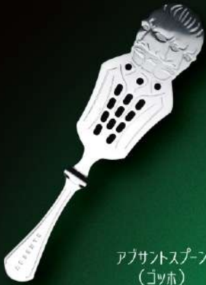
アブサントスプーン (ゴシック) 入数 10