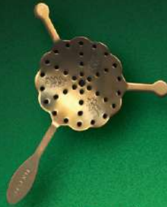
アブサントスプーン (ラウンド) 入数 10