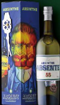
ギフト BOX(スプーン付) 入数 6